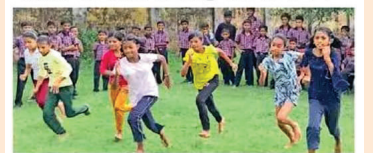
भास्कर न्यून। भूली